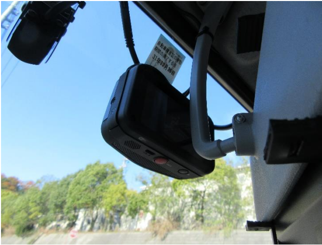
本体と全面カメラ